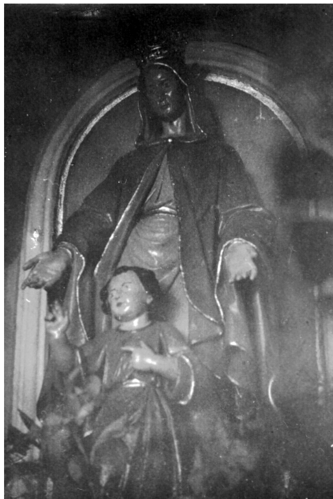
Kapelica in kip Marije pomočnice po obnovi v začetku 70-ih let