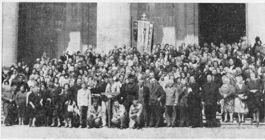
Slovenski romarji pred novo Marijino baziliko v Oropi

»Mala hiša božje Previdnosti« v Turinu: mesto v mestu: mesto trpljenja in ljubezni, vere in krščanske ljubezni! V Cotto-