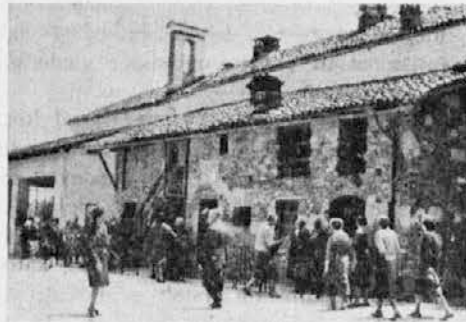
Rojstna hišica sv. Janeza Bosca