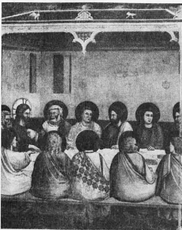
Giotto: Zadnja večerja

Na veliko noč se pripravljamo s 40-dnevno postom, zlasti na tihi, cvetni in veliki teden. V tem času se vsa družina udeležuje pobožnosti križevega pota v cerkvi, kadar in kakor je kod navada, se udeležuje postnih govorov in verskih obredov; ne opuščajte tega ne starši ne otroci.