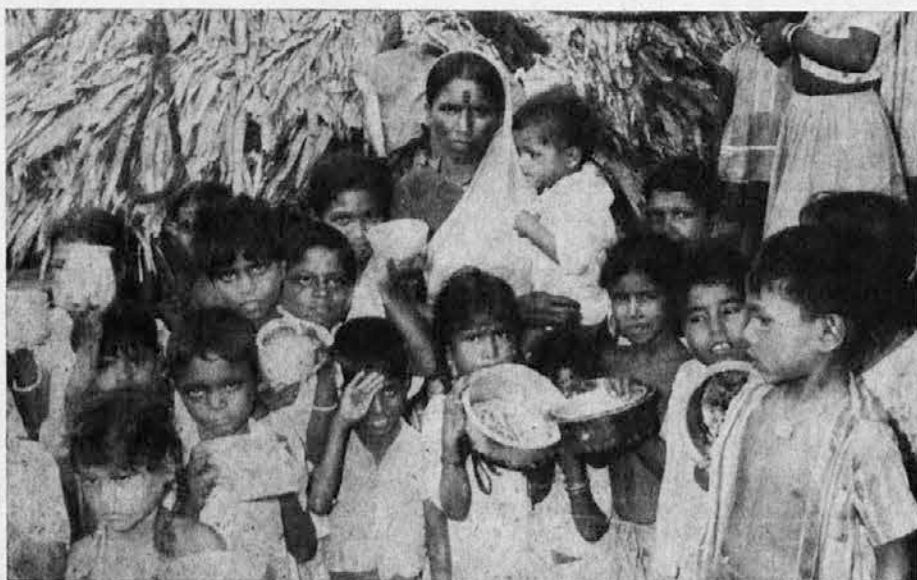
Lačni in sestradani čakajo ti indijski otroci na hrano. Kdo jim jo bo preskrbel? Krščanska ljubezen je prva poklicana, da jo preskrbi