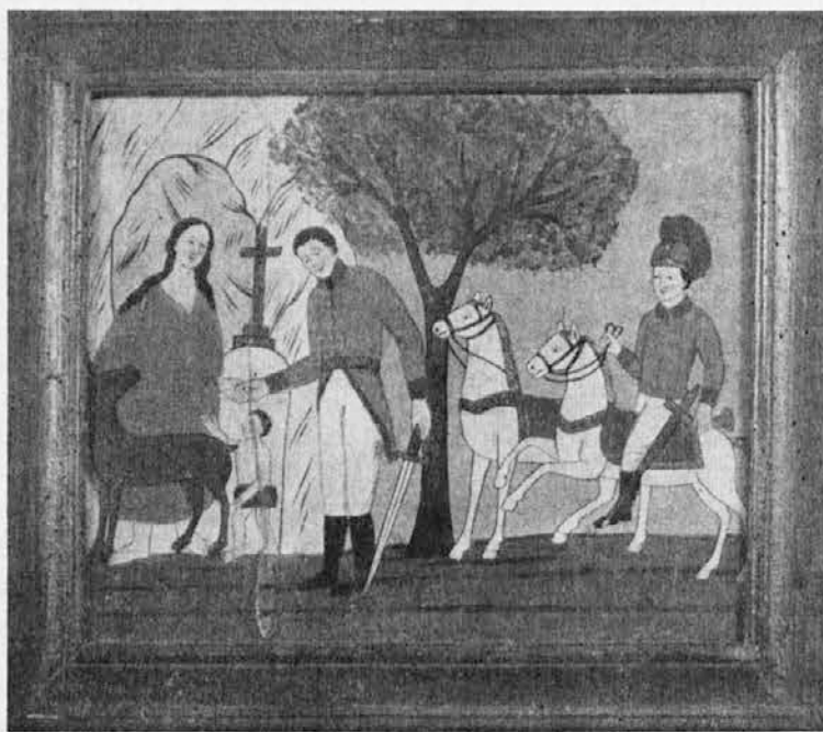
Z razstave slovenske nabožne ljudske umetnosti v Katoliškem domu v Gorici: Legenda o sv. Genovefi. Slika na steklo iz 19. stoletja, ki se hrani v Slovenskem etnografskem muzeju v Ljubljani