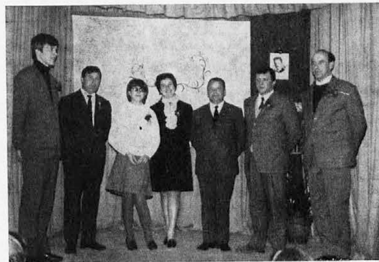
S Cankarjeve proslave v Doberdubu ob petdesetletnici njegove smrti

Vsem nastopajočim, zlasti režiserju in pevovodjem naše iskrene čestitke in vsa zahvala z željo, da nam bodo še kaj podobnega prikazali. Upamo, da se bodo takrat tudi naši vaščani bolje izkazali z udeležbo.