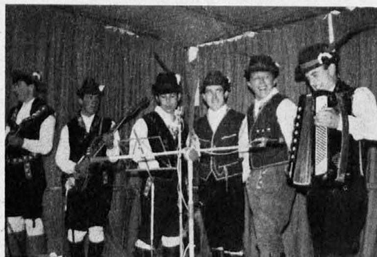
Glasbena skupina veselih fantov »Jana« iz Števerjana, ki je z veselimi vizami odprla letošnje prvomajsko slavlje v Števerjanu