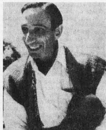
Msgr. Ivan Illich, ki je prišel zaradi svojevoljnih stališč v spor s Kongregacijo za verski nauk

Veliko se zadnje čase piše o msgr. Ivana Illichu, ki je v mehiškem mestu Cuernavaca ravnatelj zavoda, ki naj bi severnoameriške duhovnike usposabljal za apostolsko delo v državah Južne Amerike, pa je prišel navzkriž s Sv. sedežem, tako da je kardinal Šeper, prefekt sv. kongregacije za verski nauk, duhovnikom in redovnikom prepovedal obiskovanje tega zavoda.