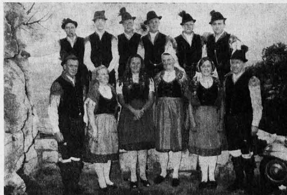
Pevci iz Uke v Kanalski dolini so na 22. taboru Slovenske prosvete osvojili občinstvo tako s svojo pesmijo kot s svojo slikovito nošo