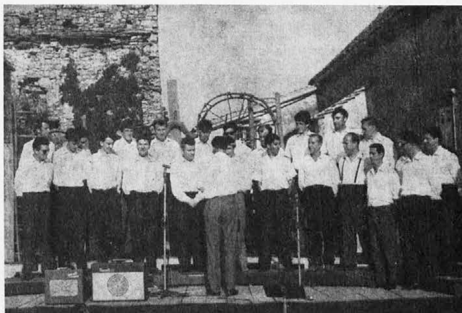
Moški zbor »Mirko Filej« iz Gorice je bil eden zelo uspešnih zborov, ki so nastopili v nedeljo, 22. junija na Repentabru pri Trstu

Ko želimo vsem mirnega počitka v teh poletnih dneh, vabimo v septembru znova vse na novo prosvetno delo.