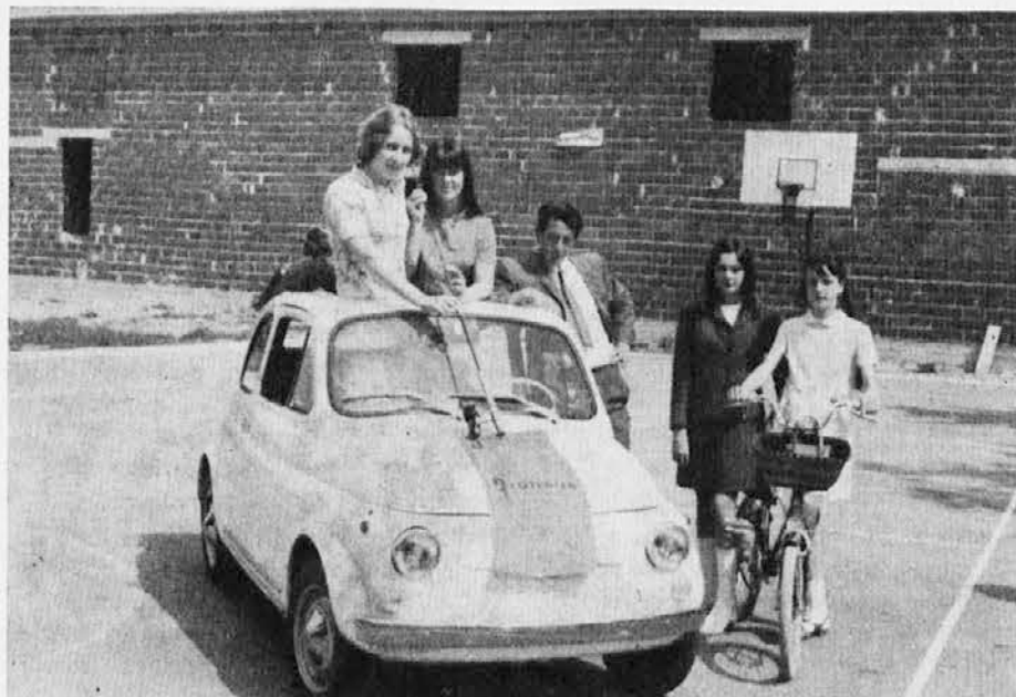
»Avto te čaka, um ti je dan, našel ga boš, če nisi zaspan« (prosto po Vodniku). Ta avto lahko najdeš, če si nabaviš srečke loterije, ki bo to nedeljo, 6. julija v Doberdobu