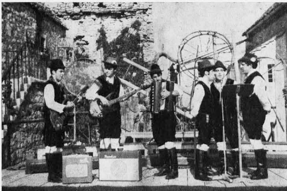
Glasbena skupina »Jana« iz Steverjana je prinesla s seboj veselo razpoloženje, ki je nato zajelo tudi vse udeležence tabora na Repentabru