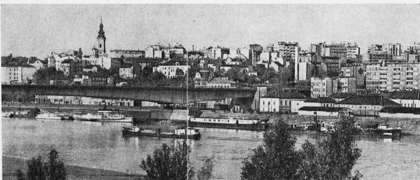
Beograd, mesto na sotočju Save in Donave ter kraj, kjer se srečujeta Vzhod in Zapad in kjer se preliva latinska kultura v bizantinsko, nudeč sedanjemu pokoncilskemu času vrsto možnosti za iskren ekumenski dialog. Pod šiljastim zvonikom, ki pripada pravoslavni cerkvi je videti kupolo srbske patriaršije

Pogreb je bil naslednji dan v Ravnici. Pogrebne obrede je izvršil župnik in de-