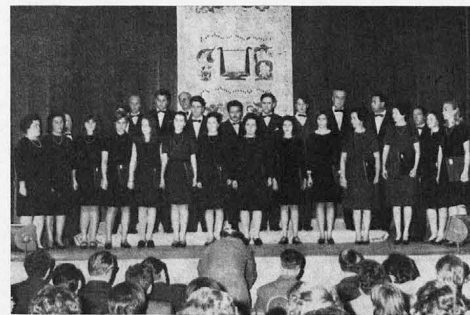
Zadnje nedelje novembra bo Zveza cerkvenih pevskih zborov na Tržaškem priredila v Kulturnem domu v Trstu revijo pevskih zborov. Objavljamo sliko cerkvenega pevskega zbora iz Sv. Ivana v Trstu, ki bo tudi nastopil na omenjeni letošnji reviji

Leta 1972 bodo v Münchnu na Bavarskem olimpijske igre. Igre zanimajo tudi cerkvene oblasti, ker bo treba poskrbeti za versko asistenco številnim atletom in obiskovalcem. Kardinal Döpfner je v ta namen sestavil posebno komisijo.