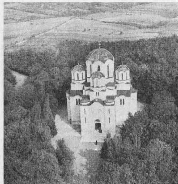
Oplenec, slavna grobnica kraljevske rodbe Karađorđević, ki jo je zgradil kralj Aleksander I., ki je v njej tudi pokopan

Pred nami se je odprla nepregledna planjava, 80 km dolga in 12 km široka, Kosovo polje. Ni več sledu o strašnih bojih med Turki in Srbi, ki so divjali po tej planjavi pred 580 leti. Le misel jih je dosegla in s trpkim nasmehom sem pomislila na mladostno navdušenje do srbskih junakov v šolskih klopek.