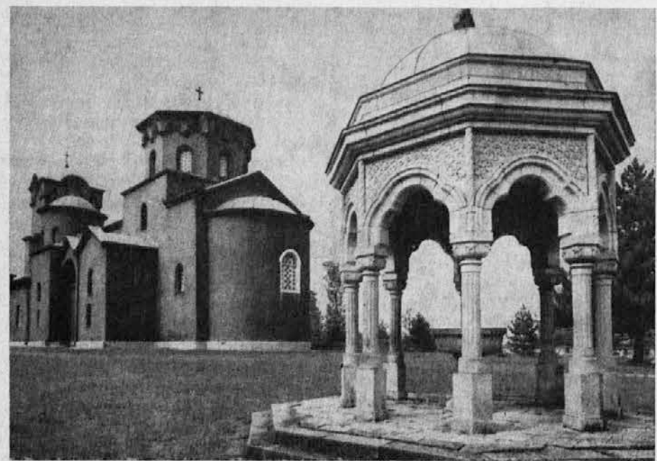
Samostan Žiča, prvi sedež patriarha srbske Cerkve. Zgradil ga je kralj Stefan Prvovenčan, brat sv. Save, ki je bil prvi nadškof srbske, od Bizanca in Rima neodvisne Cerkve. Kasneje se je patriaršija preselila v Peč blizu albanskih gora, pred Turki pa se spet premestila daleč na sever, preko Save v Sremske Karlovce. Danes je patriarhov sedež v Beogradu.

Srbski monastiri zelo sličijo med seboj in so visoka šola srednjeveške umetnosti, ki se je razvila in ohranila po zastugi menihov. V teh monastirih še vedno žive menihi, ki imajo dnevne molitve in verska opravila v cerkvi, preživljajo pa se s poljedelstvom in z darovi vernikov.