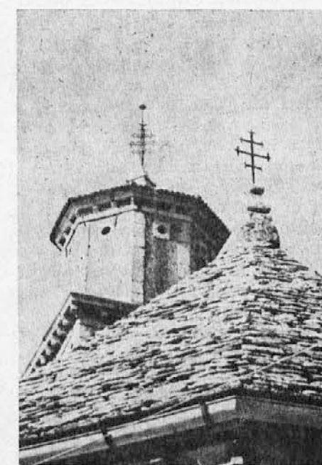
Obnovljeni križ na vrhu zgoniškega cerkvenega stolpa