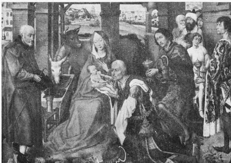
Roger van der Weiden: Modri z Vzhoda pred novorojenim božjim Detecem