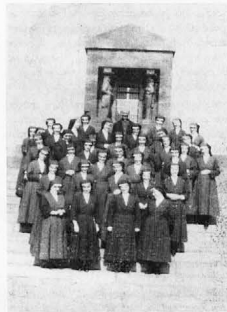
Skupina slovenskih usmiljenk na izletu na Avalo pri Beogradu, kjer stoji mogočni Meštrovčev spomenik neznanemu junaku

Dne 27. novembra, ko družba »Usmiljenih sester sv. Vincencija Pavelskega« obhaja praznik Čudodelne svetinje Brezmadežne, so slovenske usmiljenke v Beogradu intimno, pa vendar primerno, lani proslavile svoj zlati jubilej bivanja v glavnem mestu Jugoslavije — v Beogradu.