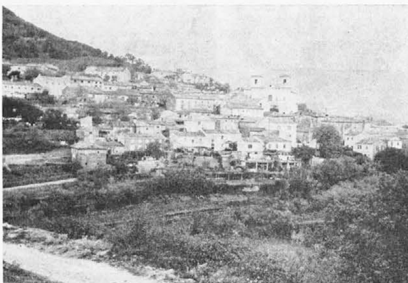
Pogled na prijazno vasico Ricmanje, ki s sončnega tržaškega Brega dan in noč zre na »morje adrijskook«

Kako imenitno je bilo takrat versko združenje, priča tudi dejstvo, da se je v novo »Zlato knjigo« bratovščine prvi vpisal sam avstrijski nadvojvoda Jožef, sin cesarice Marije Terezije in poznejši cesar