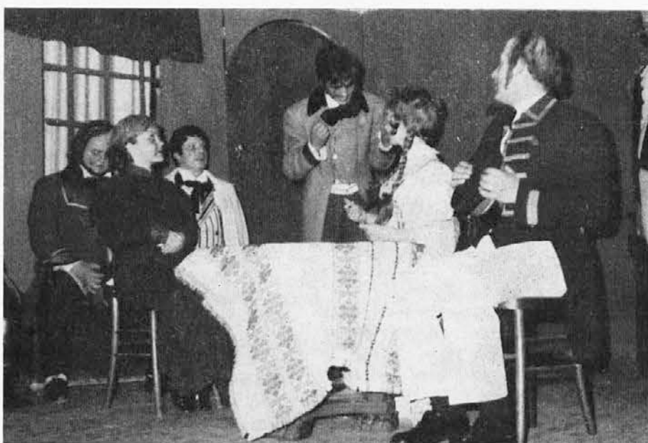
Prizor iz Gogoljeve šaloigre »Zenitev«, ki jo je dramska skupina PD »Standrež« petkrat predvajala