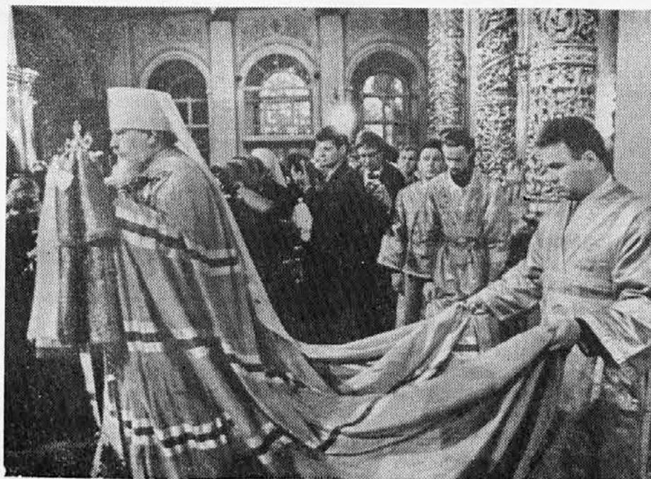
Novi ruski patriarh Pimen v trenutku, ko blagoslovlja množico v cerkvi Bogojavljenja v Moskvi, kjer je bil 3. junija slovesno ustoličen. V svetu se je imenoval Sergej Mihajlovič, in je bil rojen leta 1910. Duhovnik je postal leta 1931, v škofa pa je bil posvečen leta 1957. Za predhodno volitev kakor tudi za potrditev novega patriarha je bilo potrebno dovoljenje sovjetske vlade, kar meče čudno luč na tako imenovano ločitev Cerkev od države v komunističnih državah

Teološko fakulteto v Parizu obiskuje letos 270 laikov. Lani jih je bilo 150. Od teh je ena tretjina moških in dve tretjini žensk. Pripadajo raznim poklicem.