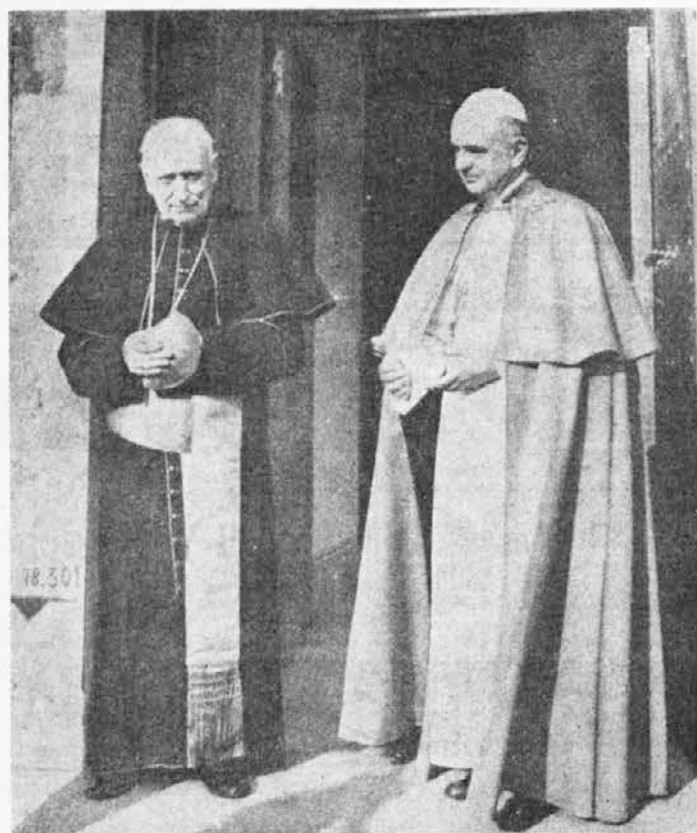
Za sv. očeta Pavla VI. je bilo veliko zadoščenje, da je mogel končno pozdraviti v Vatikanu velikega pričevalca vere kardinala Mindszentyja. Trenutno se še ne ve, ali bo Mindszenty ostal v Rimu ali pa se naselil kje bliže svoji domovini, npr. na Dunaju

Ko je pretekli mesec sv. oče izpolnil 74 let življenja, so mnoge svetovne agencije objavile vest, da bo papež Pavel VI., ko bo star 75 let, odstopil. Pri tem so se sklicevale na dunajskega kardinala Köni- ga in turinskega kardinala Pellegrina, ki naj bi dala izjave v tem smislu.