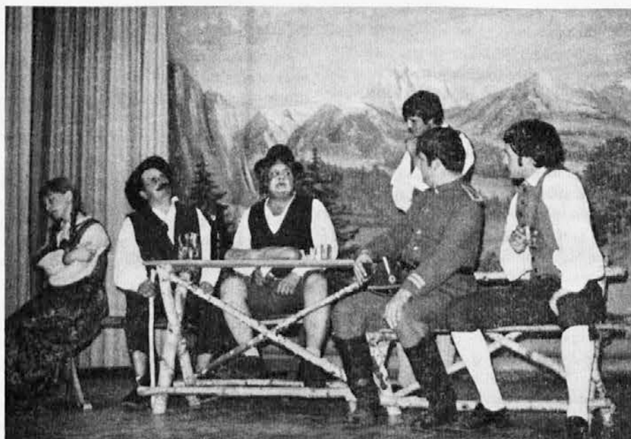
Na prireditvi za misijone na misijonsko nedeljo bodo v Katoliškem domu nastopili tudi člani igralske družine prosvetnega društva »Standreža« z Levstikovim igrokazom »Juntez«. Enega od prizorov iz te prijetne igre lahko vidimo že danes na tej sliki