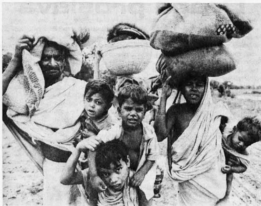
O tragediji ljudstva v Vzhodnem Pakistanu, ki je dejanska pakistanska Bengalija, se zadnje čase mnogo piše. Spomladi je prišlo do poskusa odcepitve od Zahodnega Pakistana, a vojska je ta poskus osamosvojitve surovo zatrla. Od tedaj Bengalci ne prestopajo več v Indijo, kjer se je sedaj nabralo že nad 8 milijonov beguncev. Sv. oče je v začetku tega meseca pozval ves krščanski svet, naj za te nesrečneže molijo in jim tudi materialno pomaga. Je prišel ta poziv že do naših src?

Italijanska komunistična partija je na pisanje lista »Il Manifesto« odgovorila, da se njeno vodstvo sicer še ni odločilo, katerega kandidata bo podprlo, bo pa pomagalo do zmage tistemu, ki ji bo nudil več zagotovil in dal več koncesij.