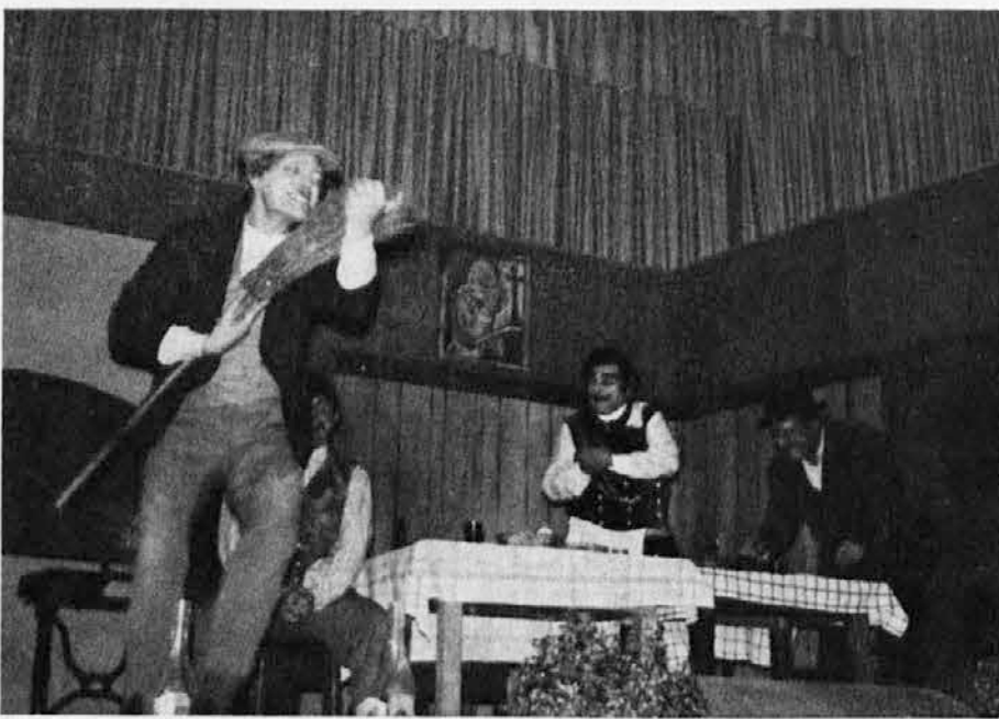
Prizor s krstne predstave Stokove ljudske igre »Trije tički«, ki jo je Slovensko gledališče iz Trsta uprizorilo 6. novembra letos v župnijski dvorani v Doberdobu

Do 30. novembra je treba prijaviti na trošarinskem uradu letošnji pridelek vina. Prijavo morajo izpolniti vsi, ki izdelujejo vino bodisi iz lastnega bodisi iz kupljenega grozdja.