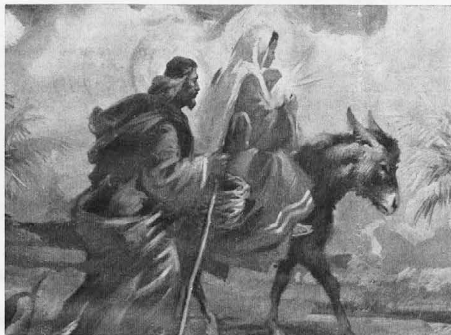
Vstop v novo leto je pot v neznanost. Toda s Kristusom postane pot gotova, čeprav bi bila tudi polna preizkušenj in težav

In to se dogaja zato, ker je pravičnost učinkovita le tedaj, če se poraja spodaj; najprej se mora roditi v slogi, ki povezuje posamezne družine, potem mora har-