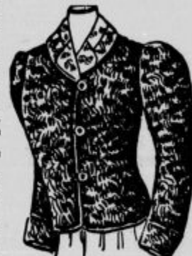
Pozornost vzbujajoča pliš-jopica z lično garn. ovratnikom K 13'—, rjava K 13'50.