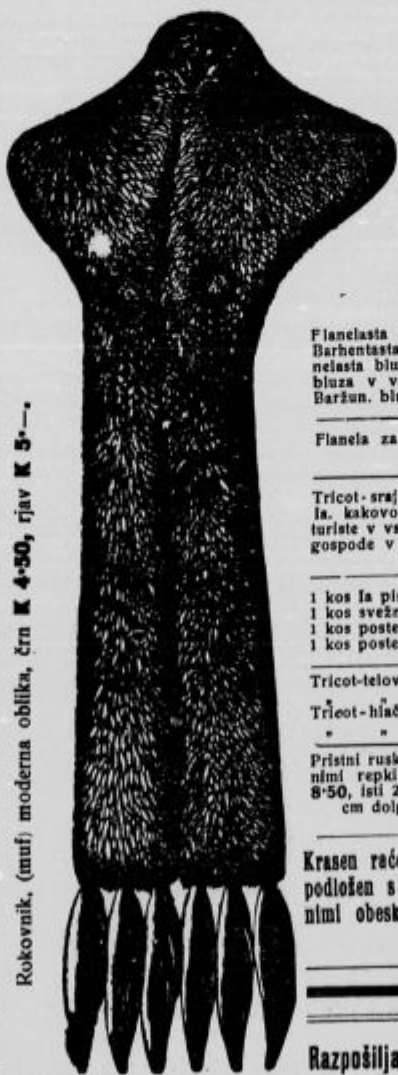
Rokovnik, (mufl) moderna oblika, črn K 4'50, rjav K 5'—.

Elegantna zimska obleka iz angl. ali gladkega blaga za kratko jopico K 14'50, ista, toda z dolgo jopico K 21'50; suknena jopica, podložna K 8'50.