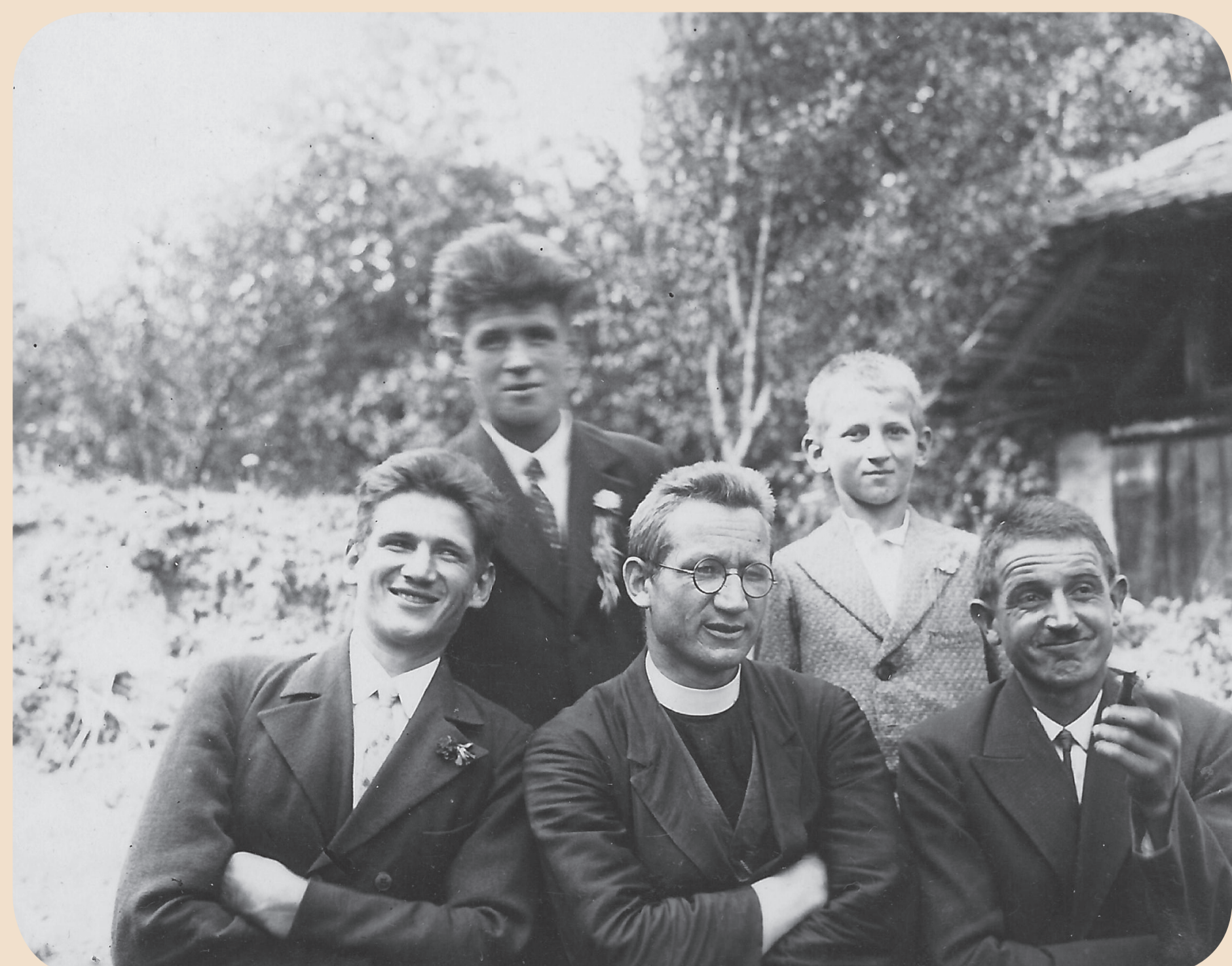
Avtor razstave: Jože Leskovec Oblikovanje: Nuša Marinč Arhiv: sorodniki msgr. Janeza Hladnika