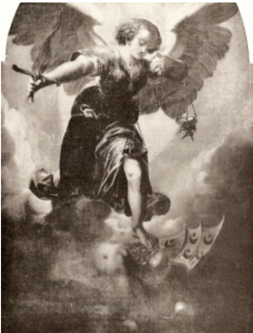
Levo: Farni Zavetnik Nadangel Mihael goduje 29. september