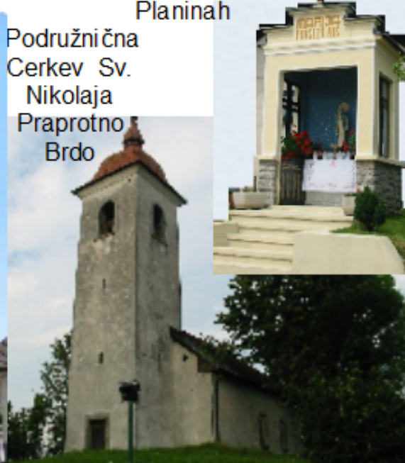
Kapela Matere Božje na Planinah