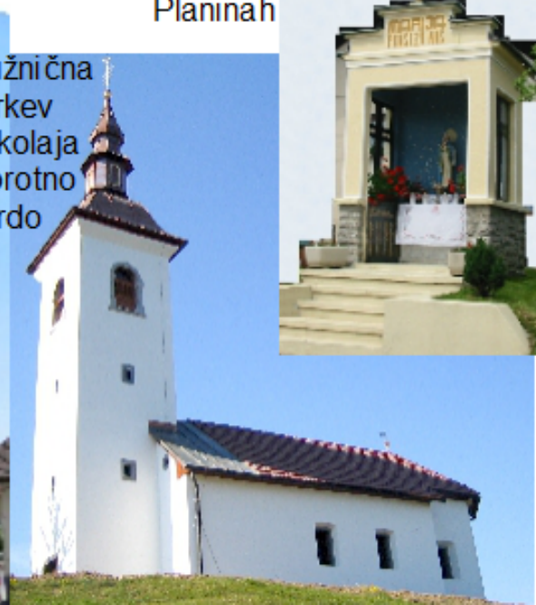
Podružnična cerkev Sv. Nikolaja Praprotno Brdo