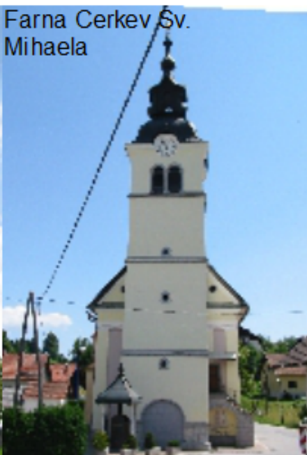
Farna Cerkev Sv. Mihaela