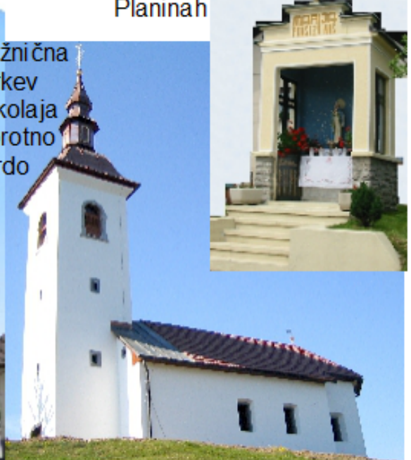
Podružnična cerkev Sv. Nikolaja Praprotno Brdo