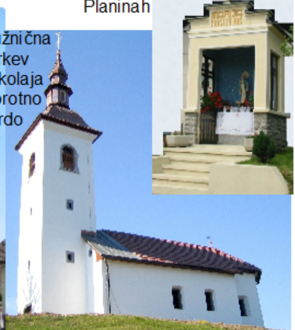
Podružnična cerkev Sv. Nikolaja Praprotno Brdo