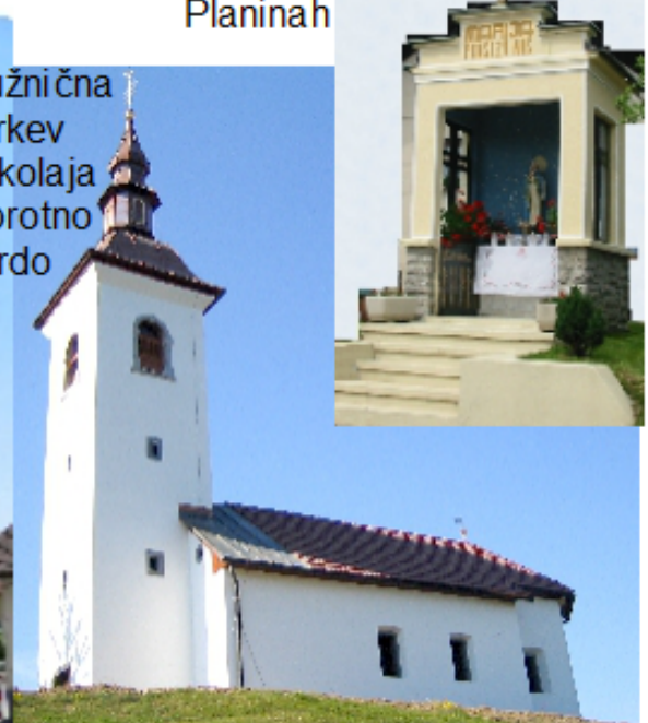
Podružnična cerkev Sv. Nikolaja Praprotno Brdo