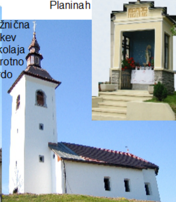
Podružnična cerkev Sv. Nikolaja Praprotno Brdo