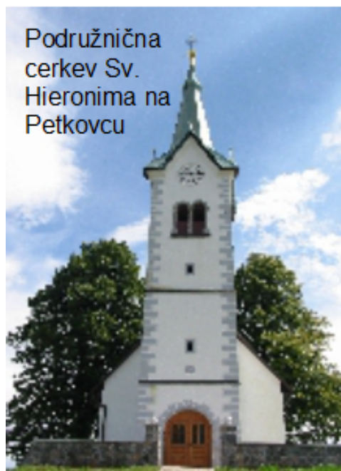
Podružnična cerkev Sv. Hieronima na Petkovcu