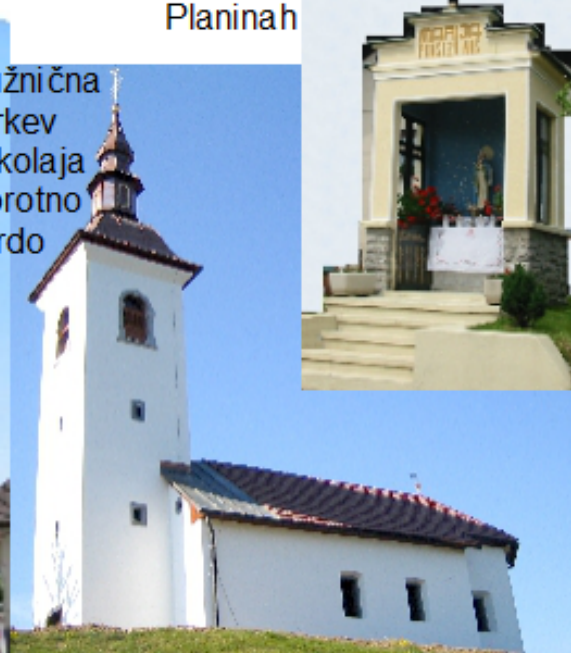
Podružnična cerkev Sv. Nikolaja Praprotno Brdo